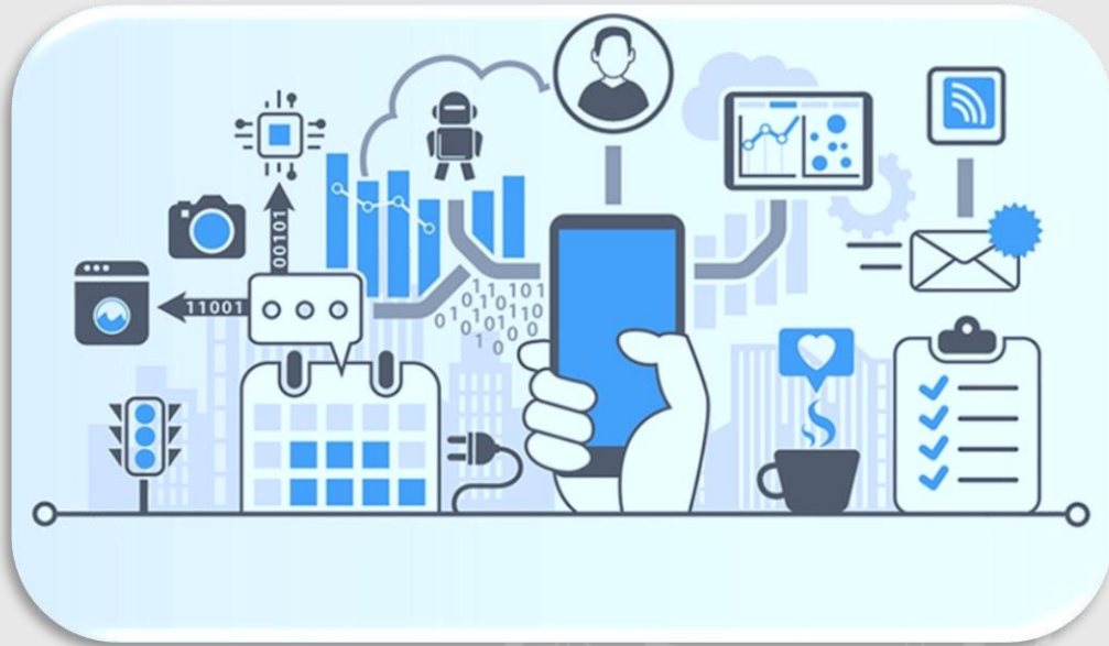
Internet Of Thing (IoT)